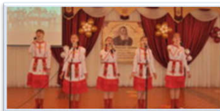
Выступление коллектива «Азамат» на научно-практической конференции «Яковлевские чтения».