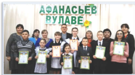
На фото команда гимназии на конференции «Афанасьевские чтения»